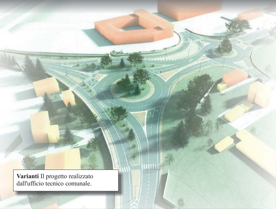
Varianti Il progetto realizzato dall'ufficio tecnico comunale.

realizzata a spese della la società proprietaria del mega-store sito di fronte al Centro Luna. Anche in questo caso il progetto, inserito nel PIIP-Pallodola, è stato redatto dall'ufficio tecnico comunale. Stanno invece per essere appaltate altre quattro importanti rotatorie che come detto hanno lo scopo di "alleggerire" il traffico limitando il più possibile code ed incolonnamenti agli incroci più transitati in particolare nelle ore di punta. Si tratta degli interventi di fronte a Villa Ollandini (incrocio viale Mazzini, via Aurelia, viale XXV Aprile e via Posta Vecchia) il cui costo è di 111mila euro, a Porta Romana dove confluiscono ben