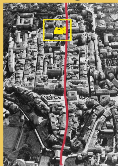
Il centro storico di Sarzana attraversato dalla via Francigena e il sito del Teatro degli Impavidi

avere un carattere soprattutto pedonale. Piccoli giardini ed aree verdi andranno ad interrompere la pavimentazione a ridosso delle proprietà private. L'arredo urbano sarà completato con panchine, cestini e cartelli indicatori con informazioni sulla via Francigena. Come detto il progetto globale prevede anche il completamento del restauro e il recupero funzionale del Teatro degli Impavidi, sorto agli inizi del XIX secolo nel sito dove si trovava il quattrocentesco convento dei Padri Domenicani. Il teatro, il secondo per importanza storica dell'intera regione Liguria, sorge in perfetta aderenza all'asse della via Francigena nel suo percorso di attraversamento della città murata. La struttura rappresenta uno dei punti chiave del centro storico e della sua complessa vicenda formativa. Il costo complessivo dell'intervento si aggira sui 6 milioni e mezzo di euro dei quali l'83% sarà a carico del Ministero delle Infrastrutture e il restante 17% circa a carico del Comune. "Il progetto