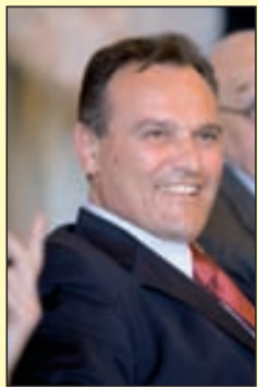
Il sindaco Massimo Caleo

QUELLA che sta per terminare è stata una legislatura difficile.